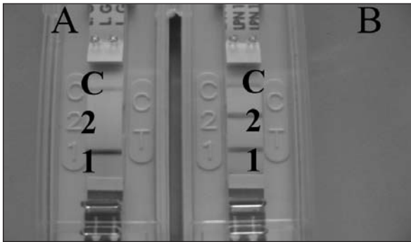
Figura III. Identificazione di Legionella pneumophila sg 2-15 mediante kit VIRapid Legionella Culture

A: strip di genere; C: banda di controllo; 1: banda genere Legionella ; 2: assente