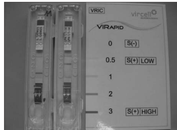
Figura I. Card di lettura del kit VIRapid Legionella Culture.